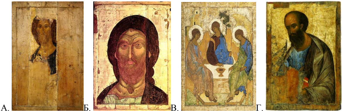
А. Б. В. Г. А) Спас Вседержитель из Звенигородского чина. Начало XV в.

6. Какие иконы, как предполагают, были исполнены Андреем Рублевым, отличавшиеся одухотворенностью образов, мягкостью, лиризмом, поэтичностью: