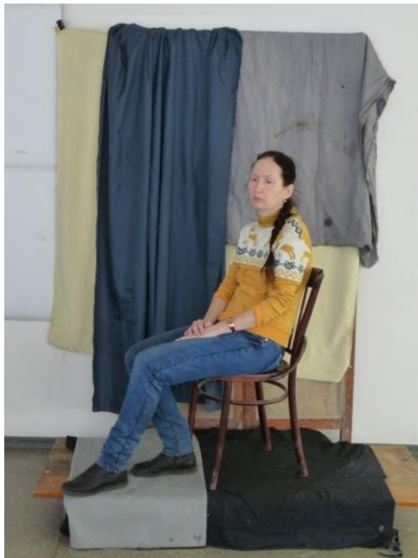
фото постановки №1