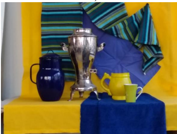
фото постановки №1 для работы

Опираясь на изображение, выполнить эскиз натюрморта, используя локально – орнаментальное решение.