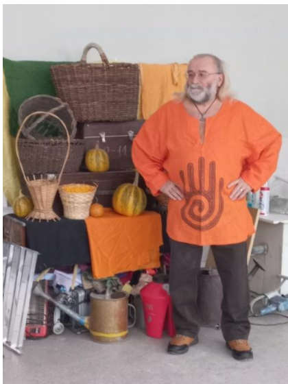
пример постановки №3

3) Пластически и образно решить композицию постановки с моделью в неглубоком пространстве интерьера. Выполнить формальный эскиз.