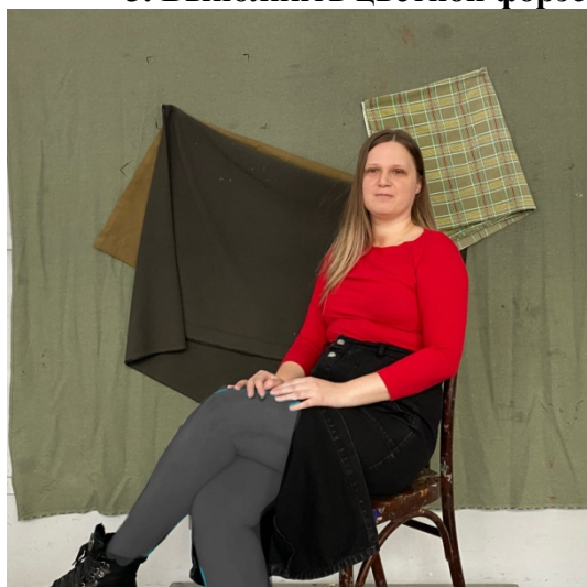
Постановка № 3