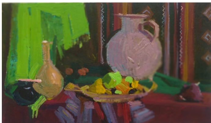
Пример ответа № 1.