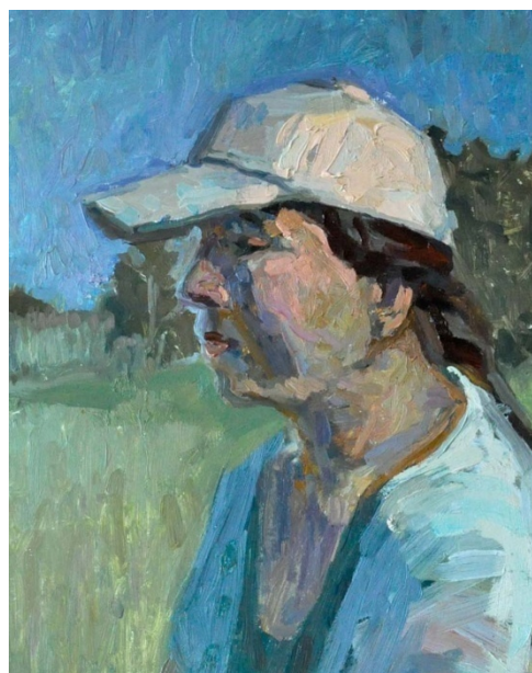
Пример задания № 2 Короткий живописный этюд головы