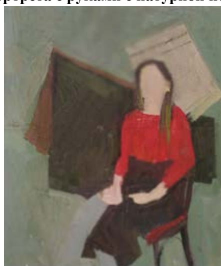
Пример ответа № 3.