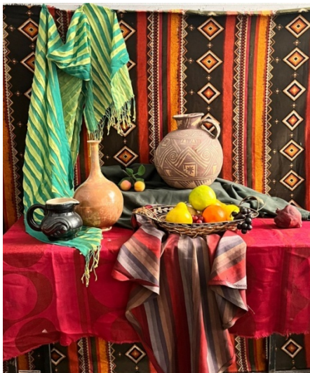
Постановка № 1