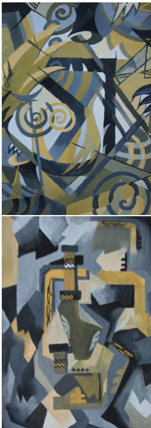
Примеры ответа № 3