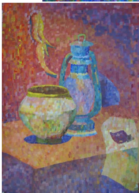
Примеры ответа №1