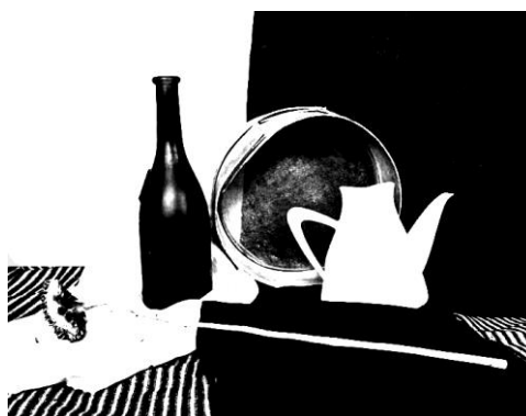
Пример ответа №1