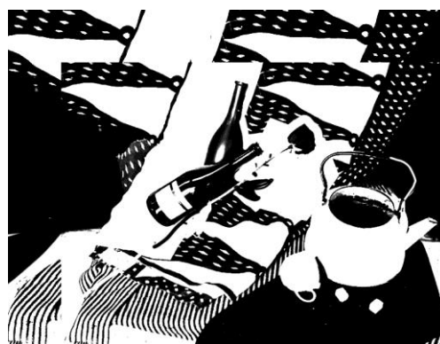
Пример ответа №1