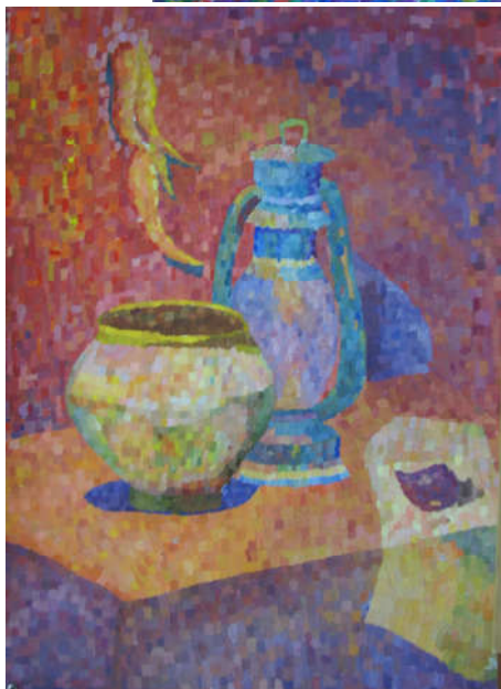
Примеры ответа №1