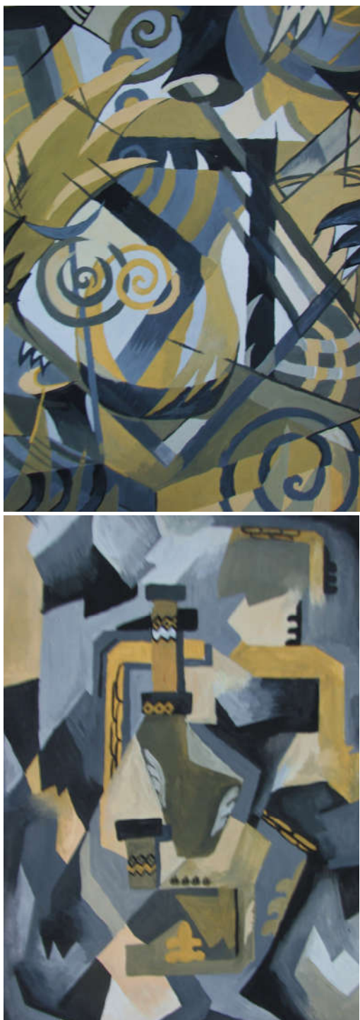
Примеры ответа № 3